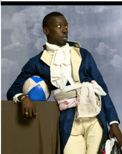
OMAR VICTOR DIOP Senegalese / Sénégalais