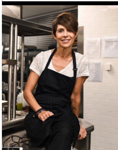
DOMINIQUE CRENN French / Française