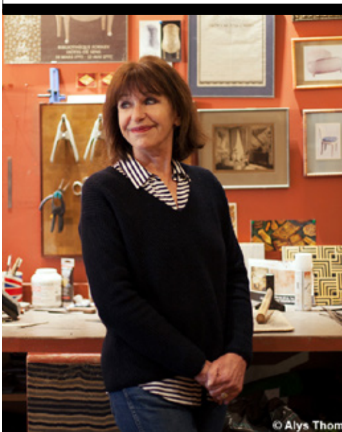
LISON DE CAUNES French / Française