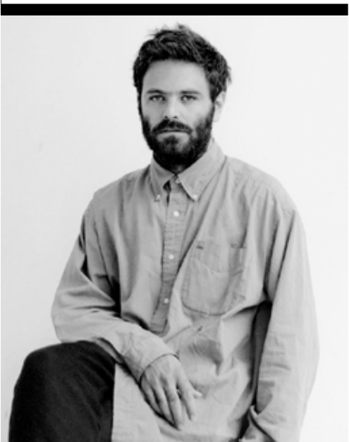
HED MAYNER Israeli / Israélien